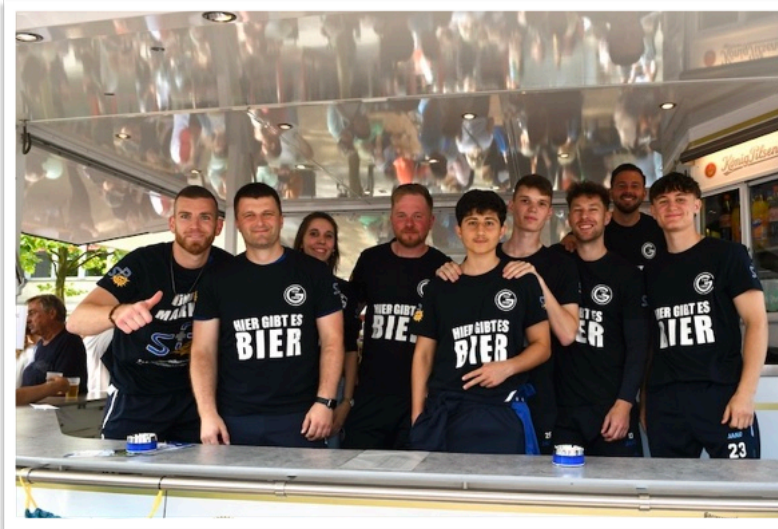
Glindes Fußballer im Dauereinsatz, aber bei bester Laune