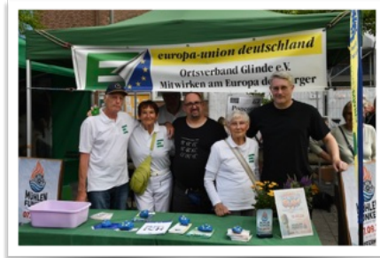
Die Europa-Union war dabei