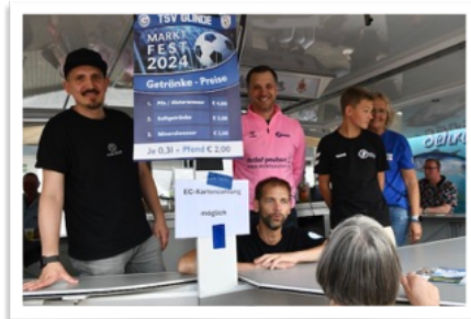
Klönsschnack am 2. Bierstand